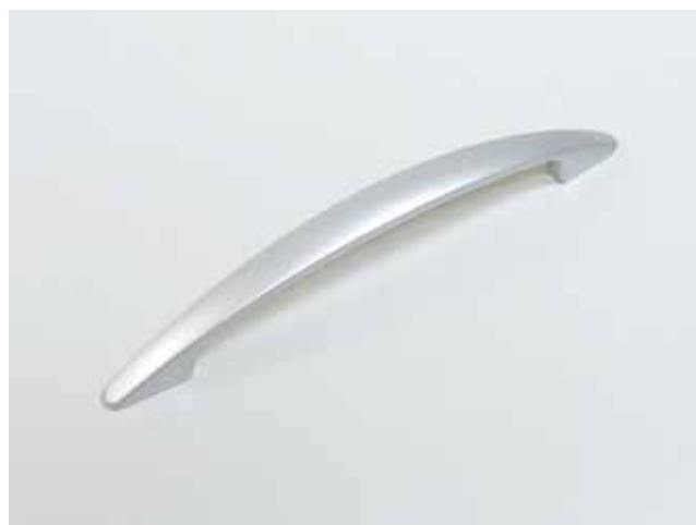
Model NO. \phi mm JT-006 128 Color: Silver / シルバー色