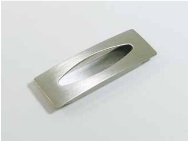
Model NO. \phi mm JT-012 76 Color: Brushed Nickel / ニッケル色