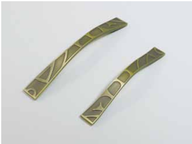
Model NO. \phi mm JT-014 96 128 Color: Copper / 銅色