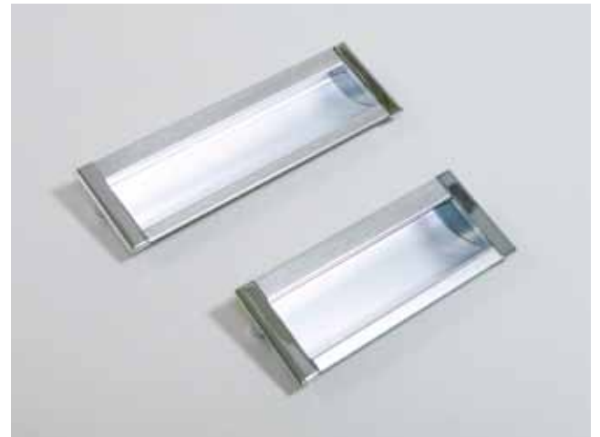
Model NO. \phi mm JT-015 96 128 Color: Silver / シルバー色