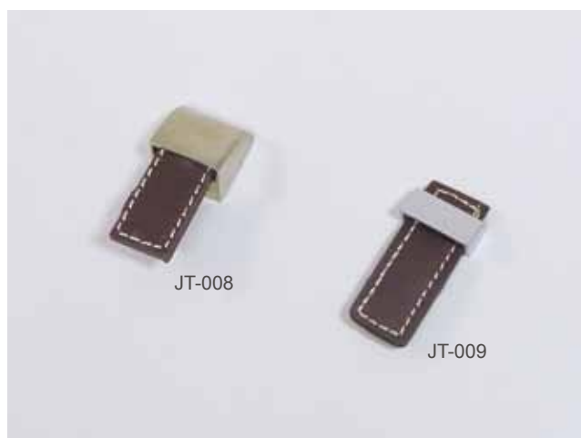
Model NO. \phi mm Dimension mm JT-008 11 H53 x W25 x D18 JT-009 X H50 x W24 x D12 Material: Leather / 牛革材