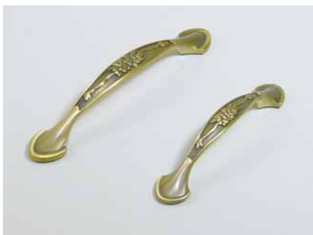
Model NO. \phi mm JT-010 96 128 Color: Copper / 銅色