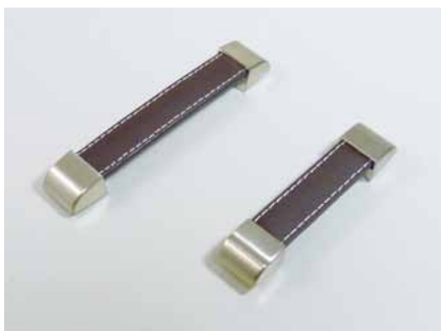
Model NO. \phi mm JT-007 96 128 Material: Leather / 牛革材