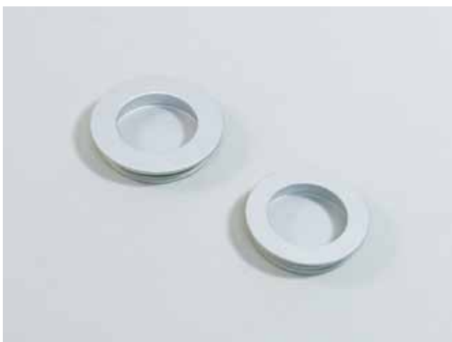
Model NO. \phi mm JT-016 35 40 Color: Silver / シルバー色