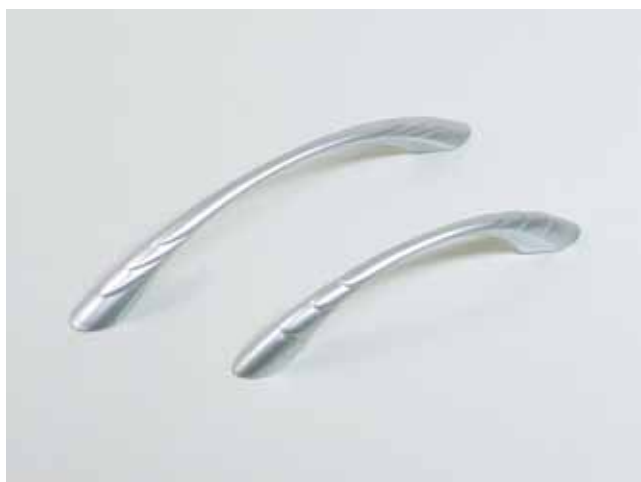
Model NO. \phi mm JT-005 96 128 Color: Silver / シルバー色