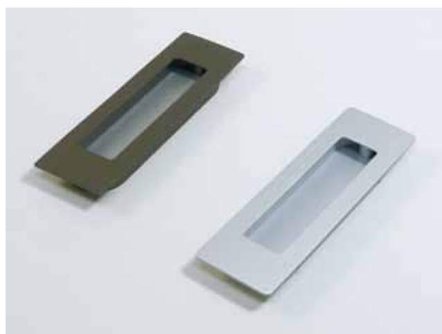
Model NO. \phi mm JT-011 76 96 128 Color: Iron gray, Silver / 鉄灰色、シルバー色

Notice: In leather or metal plating, there may be slight color differences between production runs and batches. メッキや革は、ロットにより、色の濃淡に差が生じますので、予めご了承下さい。