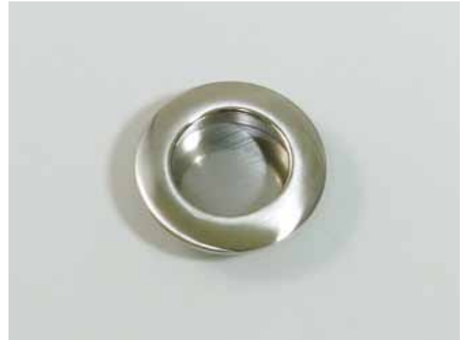
Model NO. \phi mm JT-013 54 Color: Nickel / ニッケル色