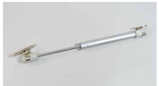
Model NO. Load kg GT-001 6 8